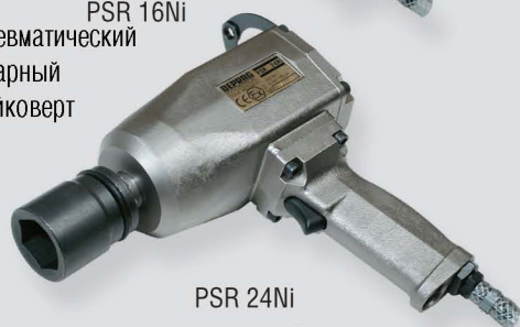
PSR 24Ni пневматический ударный гайковерт