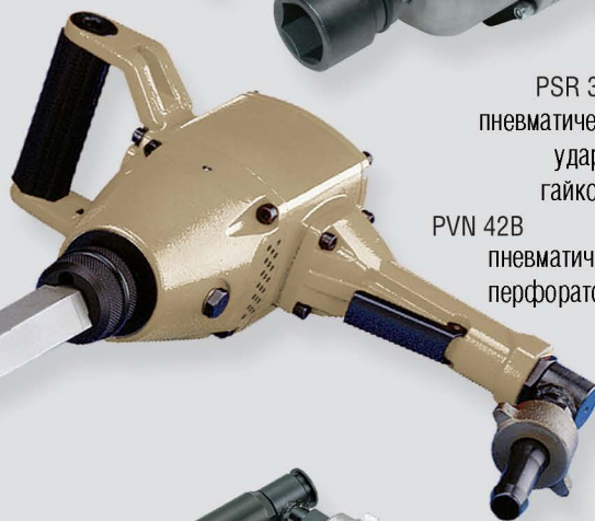
PVN 42B пневматический перфоратор