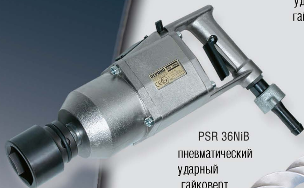
PSR 36NiB пневматический ударный гайковерт