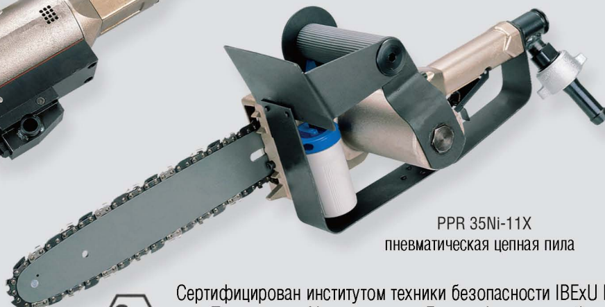
PPR 35Ni-11X пневматическая цепная пила