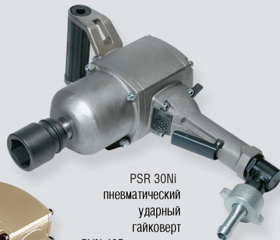
PSR 30Ni пневматический ударный гайковерт