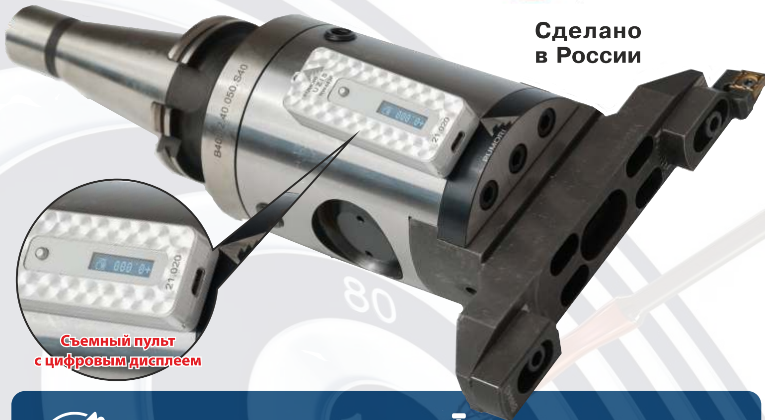
Съемный пульт с цифровым дисплеем